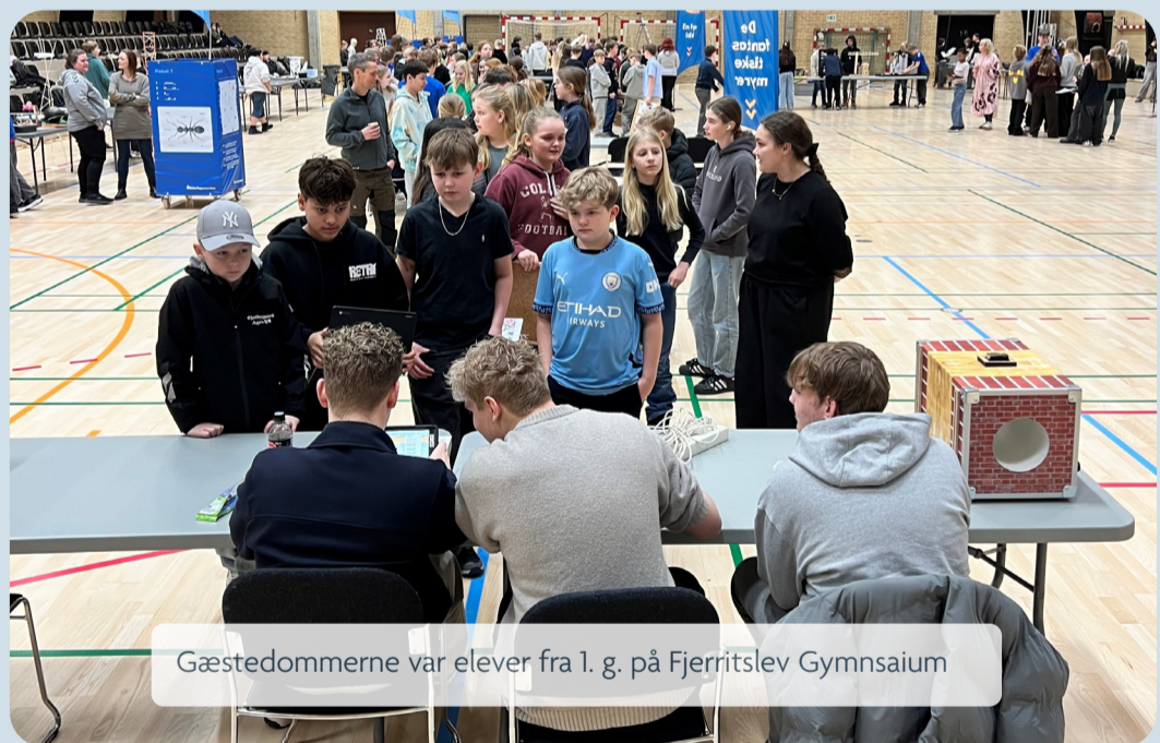
Gæstedommerne var elever fra 1. g. på Fjerritslev Gymnasium