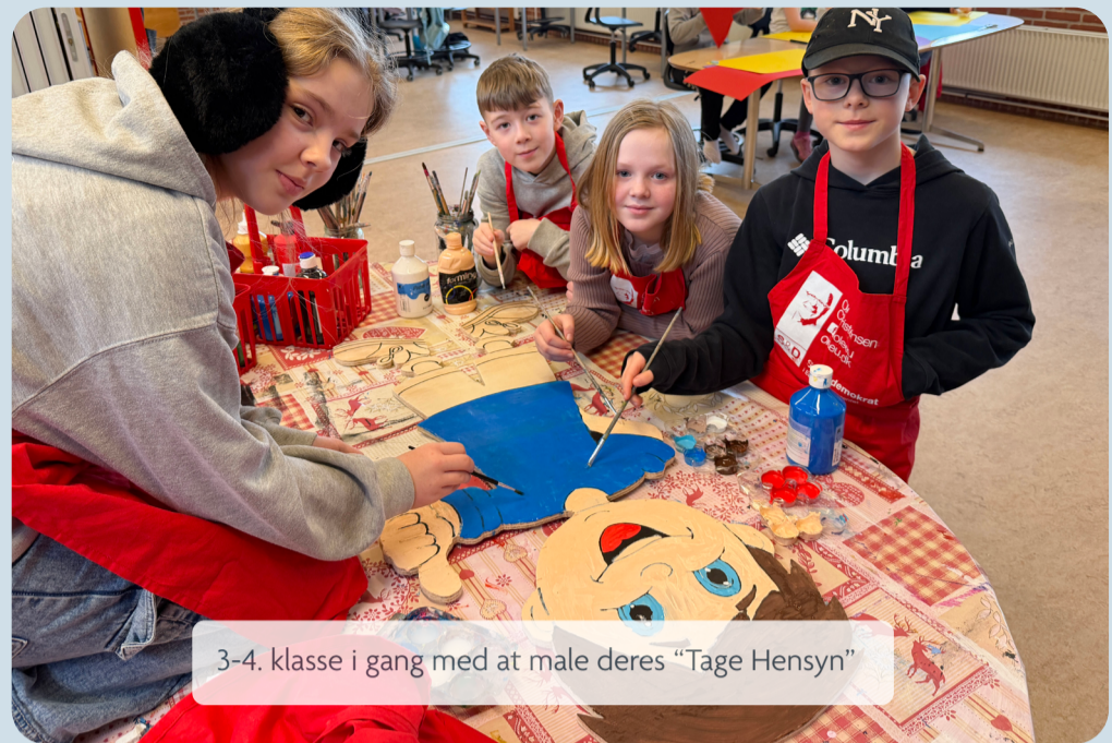
3-4. klasse i gang med at male deres "Tage Hensyn"

Idéen til "Tage Hensyn"- kampagnen er opstået på Skovsgård Tranum Skole, og der vil løbende blive fulgt op på indsatsen.