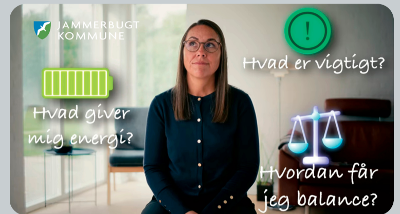
Skærbillede fra en af videoerne.

Læs mere og tilmeld dig her: 5-ugers stressforebyggende forløb - Jammerbugt Kommune